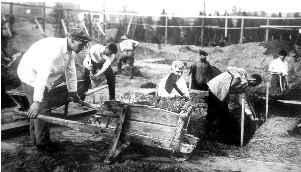
На фото: на строительстве Первого калийного комбината, 1931 г.