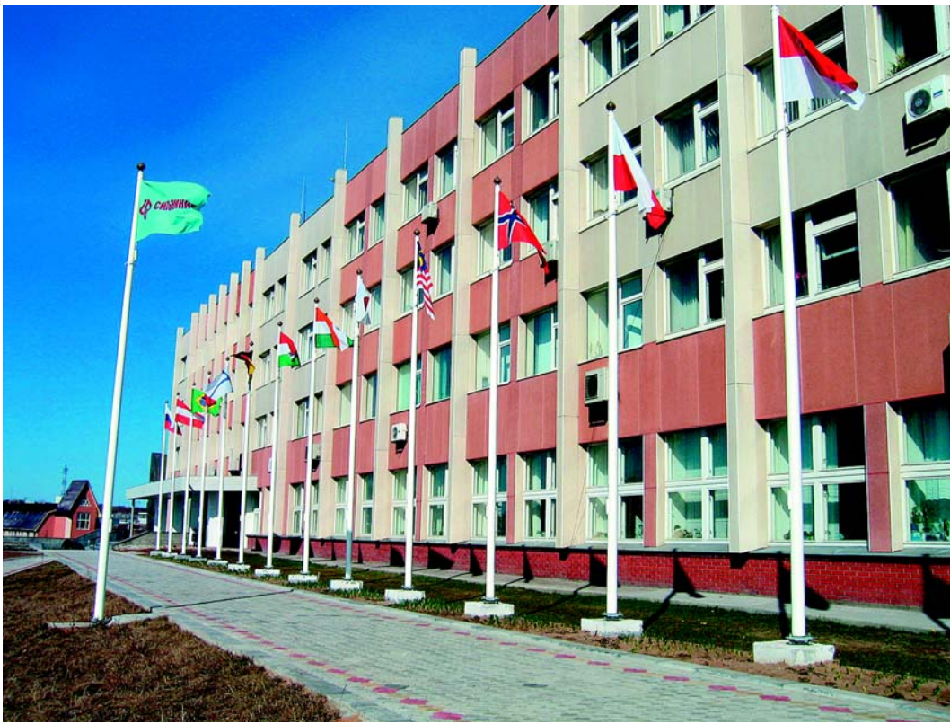
На фото: административный корпус ОАО «Сильвинит»

чить производство высококачественных гранулированных удобрений. Первые мощности по грануляции хлорида калия в бывшем СССР были введены еще в 1969–1970 гг. на Втором Солигорском комбинате, а в начале восьмидесятых такие установки появились на соликамском СКРУ-2. К 1989 г. объемы производства гранулированных удобрений на «Сильвините» достигли 620–650 тыс. тонн в год. Еще одной серьезной задачей стало увеличение процента извлечения из руды хлористого калия. Предпринятые на предприятии меры не замедлили дать результат – продукция соликамских калийщиков встала в один ряд с лучшими мировыми аналогами зарубежных производителей калийных удобрений.